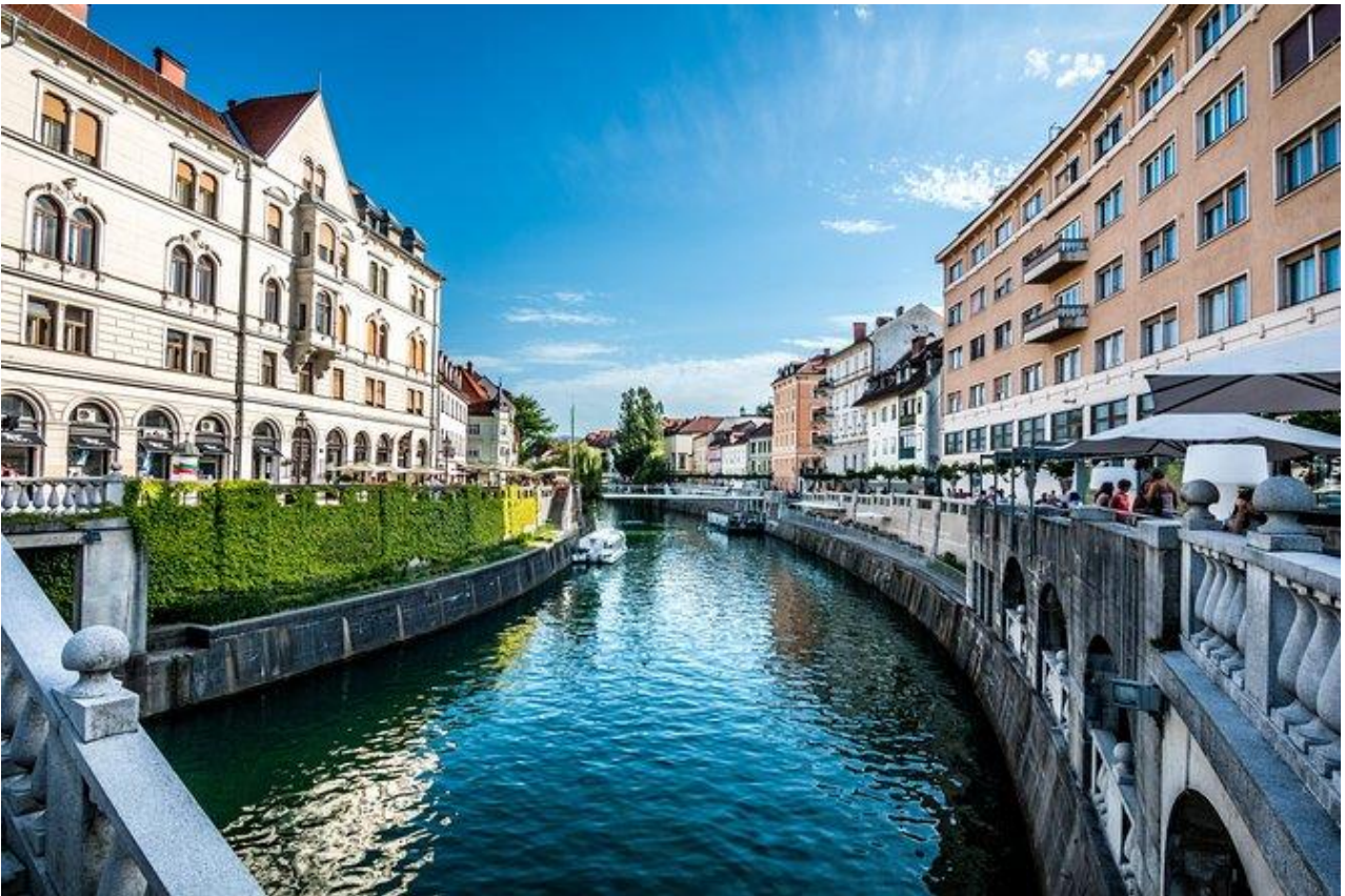
Slika 7 Ljubljanica 2

Med sprehodom po centru mesta nas spremlja tudi reka Ljubljanica, ki velja za eno najpomembnejših značilnosti Ljubljane. Reka teče skozi samo središče mesta in že stoletja pomembno vpliva na življenje v Ljubljani. V preteklosti je bila Ljubljanica pomembna trgovska in prometna pot, danes pa je predvsem priljubljen prostor za sprehode, druženje in turistične aktivnosti. Ob reki lahko opazite številne mostove, kavarne in urejene sprehajalne poti, ki mestu dajejo prijetno in živahno vzdušje. Ljubljanica danes povezuje zgodovinski del mesta s sodobnim načinom življenja ter ustvarja poseben čar, po katerem je Ljubljana prepoznavna tudi med tujimi obiskovalci.