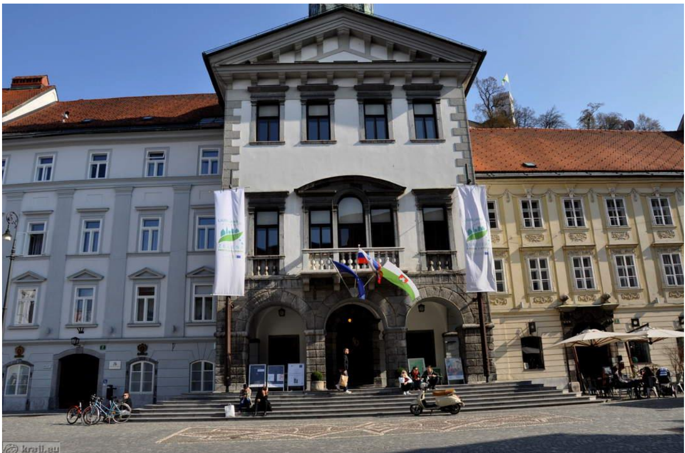
Slika 3 mestna hiša

Kot naslednjo točko našega vodenja si bomo ogledali Mestno hišo, eno najpomembnejših zgodovinskih stavb v Ljubljani in sedež mestne uprave. Stavba je bila prvotno zgrajena v 15. stoletju v gotskem slogu, kasneje pa so jo prenovili v baročnem slogu, ki ga lahko opazimo še danes. Mestna hiša je skozi stoletja predstavljala središče političnega življenja mesta. Posebnost stavbe so notranje dvorišče, arkade ter številni kamniti detajli. Danes tukaj poleg uradnih dejavnosti potekajo tudi razstave, kulturni dogodki in poroke, zato ima stavba še vedno pomembno vlogo v življenju Ljubljane.