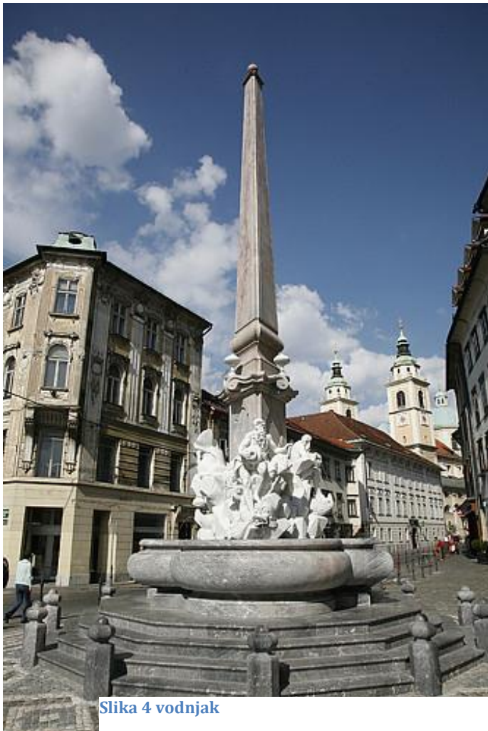
Slika 4 vodnjak

Sedaj bomo svojo pozornost namenili Robbovem vodnjaku, enemu najbolj prepoznavnih simbolov Ljubljane in pomembnemu delu baročne umetnosti. Ustvaril ga je italijanski kipar Francesco Robba v 18. stoletju in stoji tik pred Mestno hišo. Vodnjak krasijo tri moške figure, ki predstavljajo reke Savo, Ljubljanico in Krko. Skupaj z osrednjim obeliskom tvorijo značilno baročno podobo vodnjaka. Zaradi zaščite pred vremenskimi vplivi je danes na trgu postavljena kopija, original pa hranijo v Narodni galeriji. Robbov vodnjak danes velja za eno najlepših baročnih umetnin v Sloveniji in pomemben simbol Ljubljane.