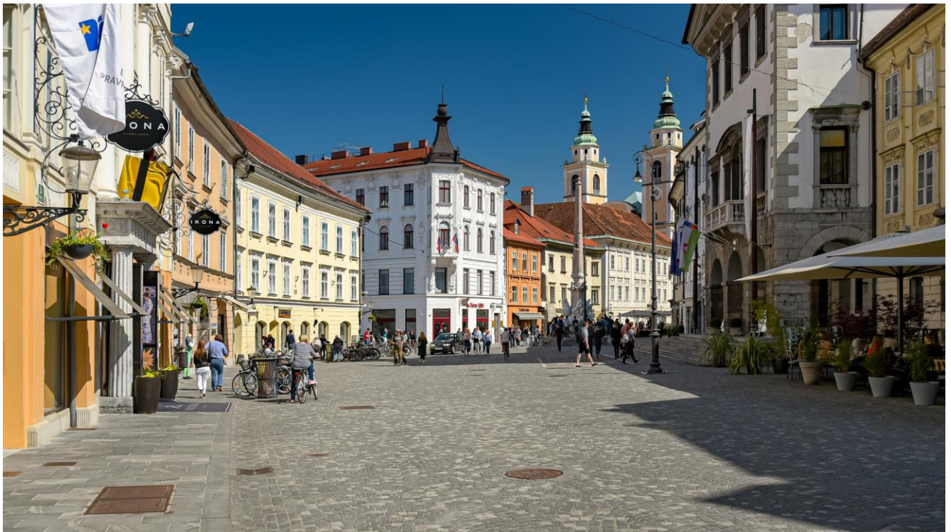
Slika 2 mestni trg

Nahajamo se na Mestnem trgu, enem najstarejših in najpomembnejših delov stare Ljubljane, kjer bomo začeli naše današnje vodenje. Ta trg se je razvil že v srednjem veku, ko je Ljubljana postajala pomembno trgovsko in upravno središče. Tukaj so nekoč potekale glavne mestne dejavnosti, trgovanje ter različni pomembni dogodki za meščane. Mestni trg je še danes ohranil značilen srednjeveški videz z ozkimi ulicami in starimi meščanskimi hišami, ki nam prikazujejo bogato zgodovino mesta. Danes je trg ena najbolj obiskanih točk v Ljubljani, saj povezuje pomembne dele starega mestnega jedra ter predstavlja pravo središče zgodovinskega in turističnega dogajanja.