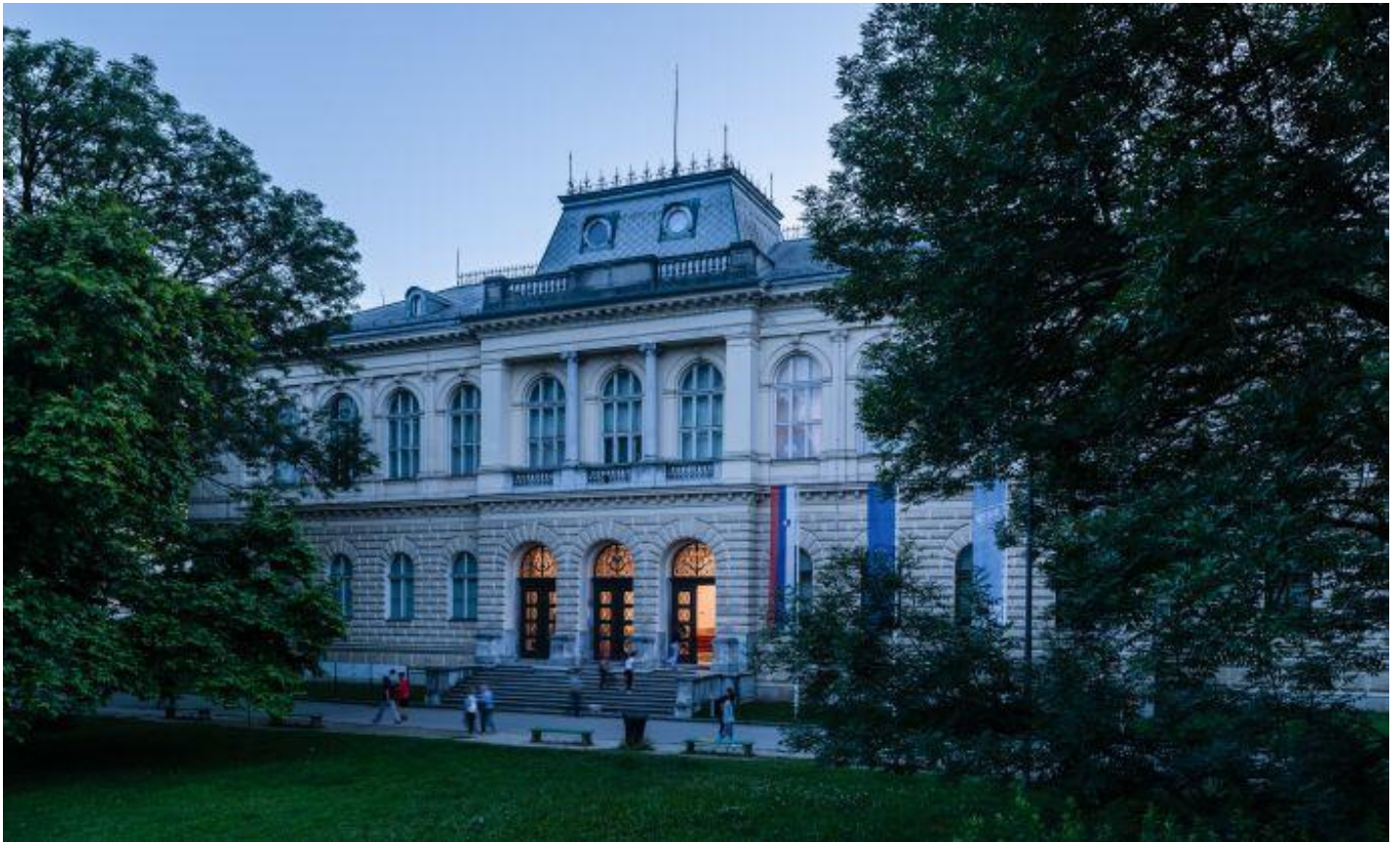
Slika 11 Narodni muzej slovenije

V muzeju lahko spoznamo razvoj slovenskega prostora od prazgodovine pa vse do novega veka. Med najbolj znanimi eksponati je tudi neandertalčeva piščal iz Divjih bab, ki velja za eno najstarejših glasbil na svetu. Narodni muzej nam tako ponuja vpogled v rimsko obdobje, srednji vek in razvoj slovenskega naroda ter je ena ključnih točk za razumevanje naše kulturne dediščine. Tukaj si bomo vzeli čas, da spoznamo, kako bogata je zgodovina prostora, po katerem danes hodimo.