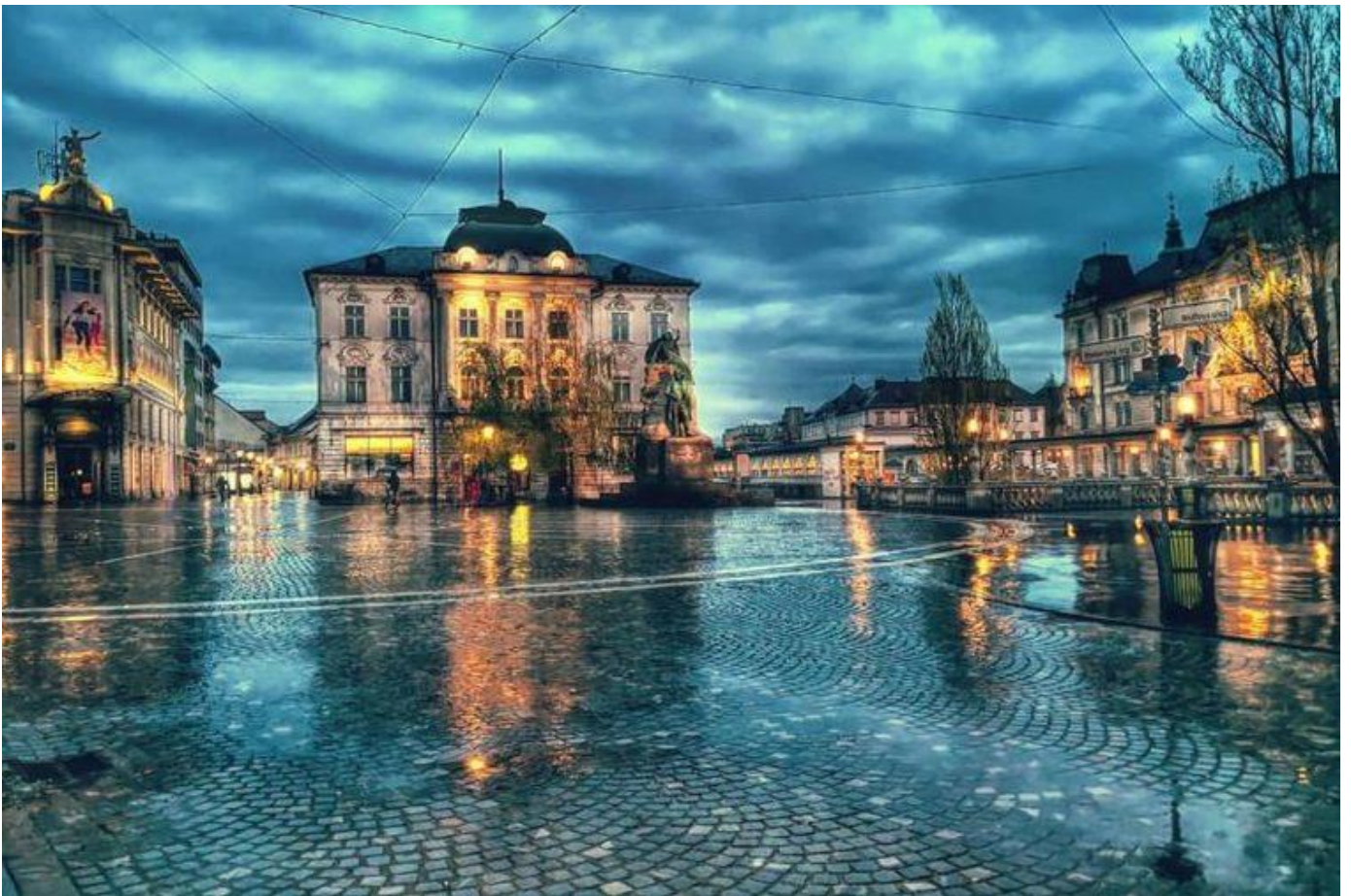
Slika 6 Prešernov trg

Sedaj smo prispeli na Prešernov trg, ki velja za srce Ljubljane in eno glavnih zbirališč v mestu. Trg je poimenovan po največjem slovenskem pesniku, France Prešeren, katerega kip lahko vidite pred nami. Zanimivost kipa je, da Prešeren gleda proti oknu hiše, kjer naj bi živel njegova velika ljubezen Julija Primic. Okoli trga se nahajajo pomembne zgodovinske stavbe, najbolj pa izstopa frančiškanska cerkev Marijinega oznanjenja s svojo značilno rožnato barvo. Prešernov trg je danes zelo živahen prostor, kjer se srečujejo domačini in turisti, pogosto pa tukaj potekajo tudi različni kulturni dogodki, koncerti in praznovanja. Od tukaj se lepo vidi tudi Tromostovje, zato trg predstavlja pomembno povezavo med starim mestnim jedrom in drugimi deli Ljubljane.