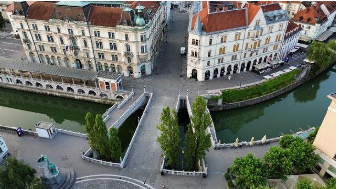
Slika 5 Tromostovje

Arhitekt Jože Plečnik je zato zasnoval posebno rešitev in ob glavnem mostu dodal še dva stranska peš mostova, s čimer je nastalo današnje Tromostovje. Danes Tromostovje velja za enega najpomembnejših simbolov Ljubljane in značilen primer Plečnikove arhitekture, po kateri je mesto prepoznavno tudi v svetu. Tukaj se pogosto zbirajo domačini in turisti, zato je območje vedno zelo živahno.