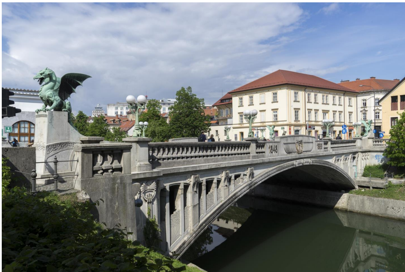
Slika 8 Zmajski most

Naš naslednji postanek je Zmajski most, eden najbolj prepoznavnih simbolov Ljubljane. Nahajamo se na mostu, ki je bil zgrajen leta 1901 in je bil v tistem času eden prvih večjih armiranobetonskih mostov v Evropi. Najbolj značilni del mostu so štirje zmaji, ki stojijo na njegovih vogalih. Zmaj je postal simbol Ljubljane po legendi o Jazonu in argonavtih, ki naj bi na območju Ljubljanskega barja premagali zmaja. Danes je Zmajski most ena najbolj fotografiranih točk v mestu in ena izmed tistih znamenitosti, ki jih preprosto ne moremo spregledati med obiskom Ljubljane.