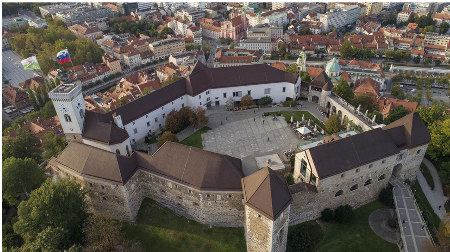
Slika 9 Ljubljanski grad

Sedaj se bomo povzpeli še na eno najbolj prepoznavnih točk Ljubljane – Ljubljanski grad, ki stoji na Grajskem griču nad mestom. Gre za eno najpomembnejših zgodovinskih znamenitosti v Sloveniji z več kot 900-letno zgodovino. Prvotno je bil zgrajen kot srednjeveška trdnjava za obrambo mesta, skozi stoletja pa je imel različne vloge – od obrambne utrdbе do rezidence plemstva in celo zapora. Danes je grad lepo obnovljen in deluje kot kulturno-turistični center, kjer potekajo razstave, koncerti in različne prireditve. Z vrha se nam odpira čudovit razgled na celo Ljubljano, kar je ena izmed najbolj priljubljenih točk za obiskovalce. Do gradu lahko pridemo peš, z vzpenjačo ali z avtomobilom, mi pa si bomo zdaj vzeli čas, da ga skupaj raziščemo.